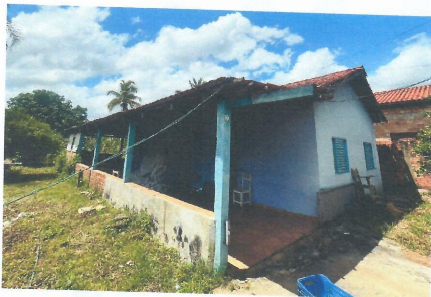
Figura 2: Interior onde está o armazenamento da merenda escolar.